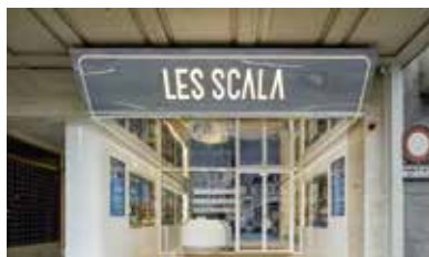
LES SCALA 23, rue des Eaux-Vives 1207 Genève www.les-scala.ch