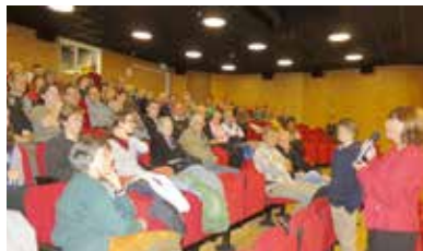
Ciné Versoix Aula du CO des Colombières 4, ch. des Colombières 1290 Versoix www.cineversoix.ch