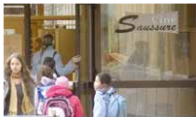
CINE Aula du collège de Saussure 9, Vieux-Chemin d'Onex 1213 Petit-Lancy www.culture-rencontre.ch/category/cinema/