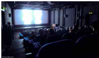
LES CINÉMAS DU GRÜTLI 16, rue du Général-Dufour 1204 Genève www.cinemas-du-grutli.ch